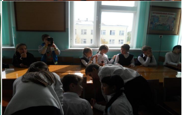
Математический КВН – 4-е классы МБОУСОШ № 2 им. А.С. Пушкина г. Моздок