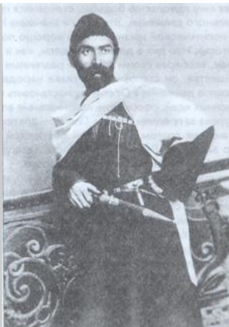
ХЕТАГУРОВ КОСТА ЛЕВАНОВИЧ ХЕТАГКАТЫ ЛЕУАНЫ ФЫРТ КЪОСТА