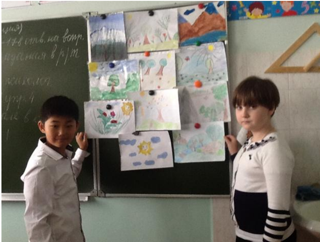
Выставка «Картина – пейзаж» по ИЗО.