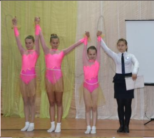
танец трех звезд «Вера Надежда Любовь»